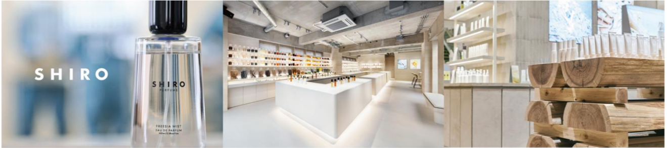
〈 SHIRO 表参道店 〉